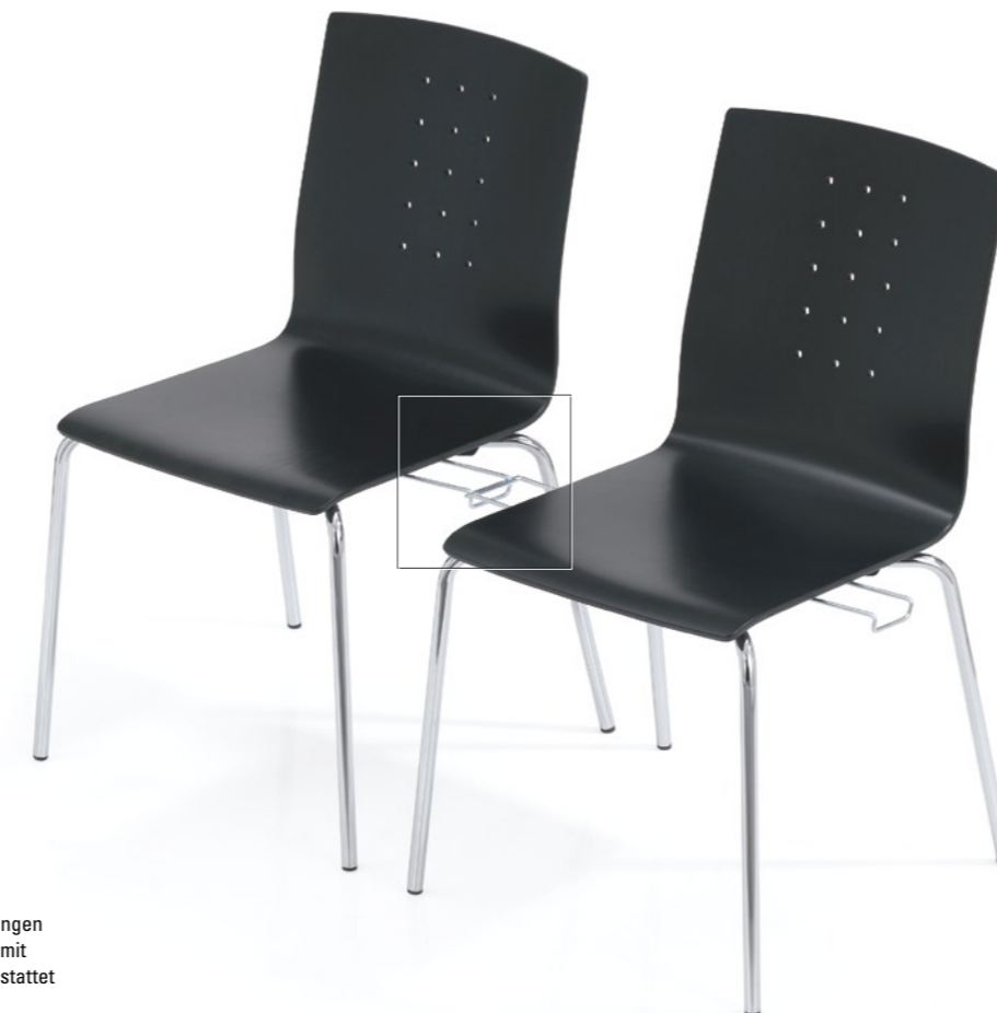
Für Auditoriumsbestuhlungen kann canto auf Wunsch mit Reihenverbindern ausgestattet werden.