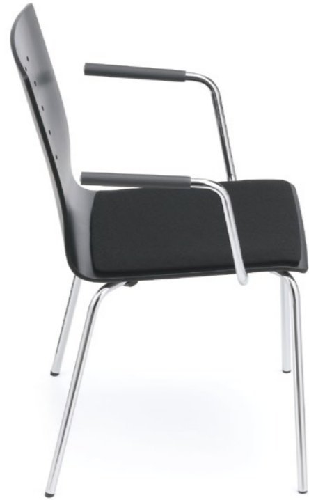
canto Stapelstuhl mit taillierter Formholzschaale und Streifenfräsung: Er besticht durch seine Anpassungsfähigkeit – ungepolstert oder mit Sitzpolster.