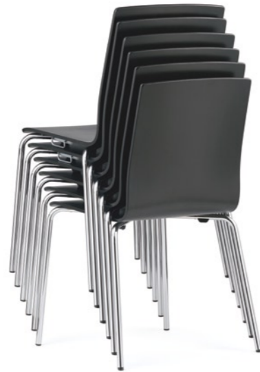
canto Stapelstuhl mit gerader Formholzschaale.